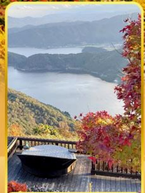
จุดชมวิวกะเลสาบิมิกาดะ