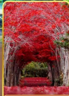
สวนฮิราโอกะ