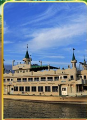
ล่องเรือทะเลสาบโทโยะ