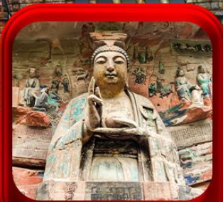
“ผาหินแกะสลักต้าจู้”

บินตรงลงฉงชิ่ง • อุ้หลง หลุมฟ้าสะพานสวรรค์ • ระเบียบแกว • อุทยานเขานางฟ้า หงหยาดัง • นิ่งรถไฟกะลุดัก • ศาลาประชาม (ด้านนอก) • หลงหมินฮ่าว มรดกโลกผาหินแกะสลักต้าจู้ • วัดหลิวฮั่น • ตึกตะเกียบ • หมู่บ้านโบราณสี่ซีโงว่