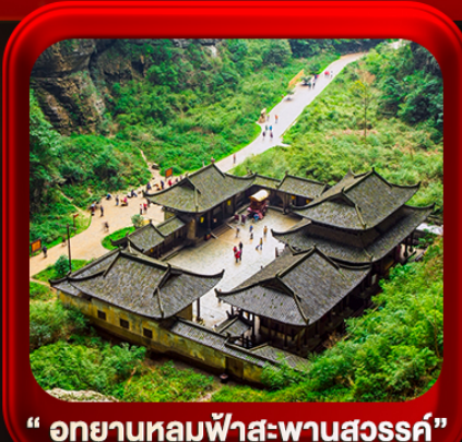
“ อุทยานหลุมฟ้าสะพานสวรรค์ ”