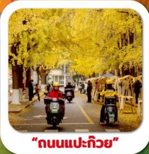
"ถนนแปะก๊วย"

นั่งกระเช้าชมภูเขาหวงอู่ซาน ขุนเขาใบไม้แดงอันดับหนึ่งของประเทศจีน เมืองชู่หนิง วัดหลิงจวน (วัดเจ้าแม่กวนอิมกะพริบตา) - พาสินแกะสลักต้าจู้ หงหยาดัง ถนนแปะก๊วย ดึกตะเกียบ วัดหลัวซัน ล่องเรือชมวิวฉงชิ่ง