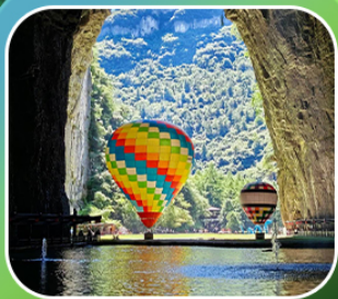
"ถ้าถึงหลง"

เที่ยวจีน 2 มณฑล เสฉวน+หูเป่ย์ (เมืองฉงชิ่ง+เมืองเอินฉ้อ) • ถ้าถึงหลง ล่องเรือมังกรกังส่วยชมวิวยามค่ำคืน • ผิงซานแกรนด์แคนยอน (รวมล่องเรือ) หงหยาดัง • วัดหลิวอัน • ถนนคนเดินเจียฟางเป่ย์ • ตึกตะเกียบ