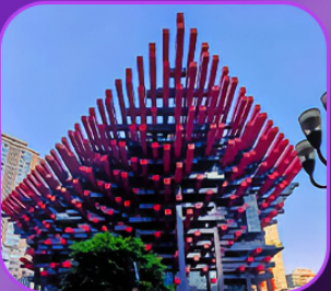
“อาคารตะเกียบ”