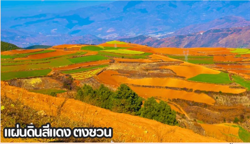
แผ่นดินสีแดง ตงชว่น

นำทุกท่านเดินทางสู่ เมืองตงชว่น (DONGCHUAN) หรือที่รู้จักกันในชื่อ หงถู่ตี้ ซึ่งแปลว่าแผ่นดินสีแดง เมืองตงชว่นตั้งอยู่ทางทิศตะวันออกเฉียงเหนือของมณฑลยูนหนาน มีภูมิประเทศเป็นทิวเขาสลับซับซ้อน ชาวพื้นเมืองส่วนใหญ่ประกอบอาชีพปลูกข้าวสาลี มันสำปะหลัง ผักต่างๆและดอกไม้ชานาพันธุ์ และตงชว่น ยังถือว่าเป็นจุดท่องเที่ยวไฮไลต์อีกหนึ่งแห่งของคุณหมิง เป็นจุดที่นักท่องเที่ยวนิยมแวะมาเก็บภาพบรรยากาศที่สวยงาม นำท่านชม ภูเขาเจ็ดสีแห่งตงชว่น หรือ แผ่นดินสีแดง (DONGCHUAN RED LAND) ตั้งอยู่ในเขตเมืองตงชว่น ทางตอนเหนือของคุณหมิง มีภูมิประเทศเป็นทิวเขาสลับซับซ้อนและ