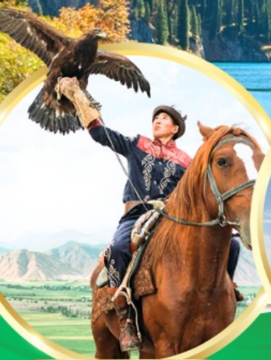
ชมโซว์นอินทรี