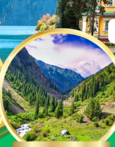
Ala Archa National Park