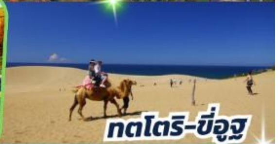
ทตโตริ-ซ็องสุ