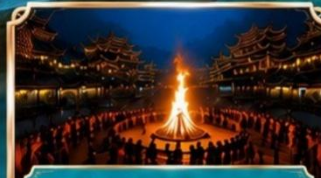
Tujia Goddess City เมืองเทพธิดาชาวตู้เจีย