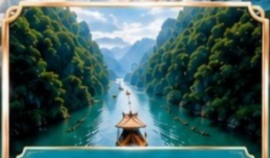
Qingjiang Grand Canyon อุทยานซิงเจียงแกรนด์แคนยอน