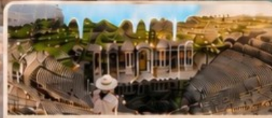
เมืองเซียราโพลิส