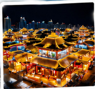
เมืองไม่หลับไหล หมิงเยว่ชานไห่เจียน Mingyue Shanhai Jian Night City