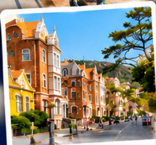
ปาตักวาน Badaguan