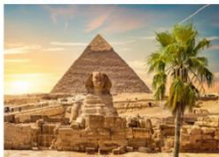
มหาพีระมิดกิซา

** พักที่ Movenpick Cairo Hotel 5* หรือเทียบเท่า **