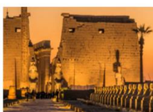
วิหารลักซอร์

** พักที่ Royal Beau Rivage Nile cruise 5* หรือเทียบเท่า **