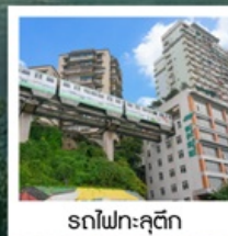
รถไฟฟ้าคุตึก

มหาศาลาประชาชน / รถไฟฟ้าคุตึก ถนนคนเดินเจียงฟางเป่ย์ / ล่องเรือสำราญ CENTURY VICTORY CRUISE ล่องเรือแม่น้ำแยงซีเกียง / โชว์สามก๊ก / ช่องแคบอุสึย ช่องแคบชวี่กั๊งเสี๋ย / นั่งเรือเล็กชมเส้นหนึ่งซี / งานเลี้ยงอำลาจากทางเรือ นั่งลิฟท์ข้ามเขื่อนซานเสี๋ยต้าป้า / Three Gorges Project Museum