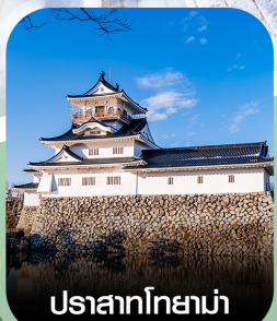
ปราสาทโทยาม่า