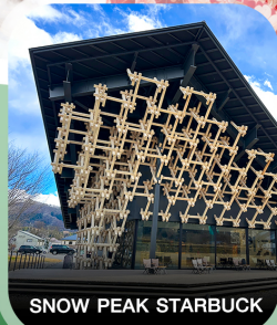
SNOW PEAK STARBUCK

คอนเฟิร์ม ออกเดินทาง ทุกพีเรียด 2 ท่านขึ้นไป