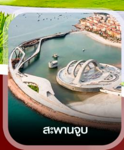
สะพานจูบ

✈️ คอนเฟิร์ม ออกเดินทาง ทุกพีเรียด 2 ท่านขึ้นไป