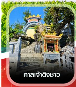
ศาลเจ้าดิงเซา