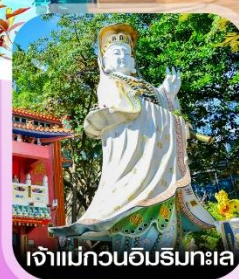
เจ้าแม่กวนอิมรมทะเล