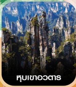
หุบเขาอวดตาร

✈️ คอนเฟิร์ม ออกเดินทาง ทุกพีเรียด 2 ท่านขึ้นไป