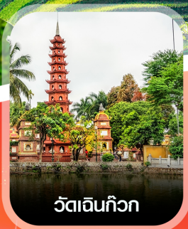
วัดอินทก๊วก

✈️ คอนเฟิร์มออกเดินทาง ทุกพีเรียด 2 ท่านขึ้นไป