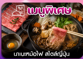
เมนูพิเศษ นาเบะคินอิโง สัตสึเมะนิ่ม