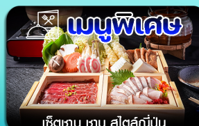
เชิเตาบุ ซาซู สีสึญี่ปุ่น