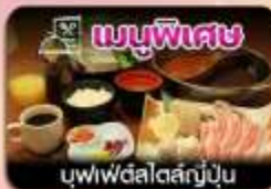
บุฟเฟ่ต์สไตล์ญี่ปุ่น

ซัปปิโร-ชมท่งดอทลาเวนเดอร์-โทมิตะฟาร์ม-ชิทชิโนะโอะกะ-น้ำตกชิราอิเกะ-บ่อน้ำสีฟ้า-อึสระซ้อปบั้งเต็มวัน-พิทออนเซน