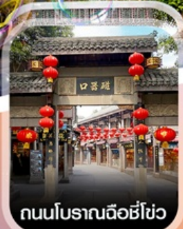
ถนนโบราณฉือชี่โฮ่ว