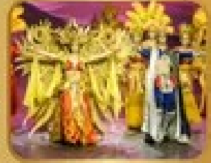
ชมการแสดงโขน/ละคร