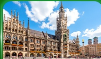
จัตุรัสมาเรียนพลัทซ์ มิวนิก