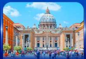
นครรัฐวาติกัน โรม