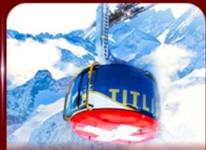
*Optional* นั่งกระเช้าชมวิวกิตติส