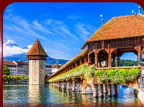
สะพานไม้อาเปลา ลูซิริน