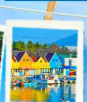
ท่าเรือสีสัน