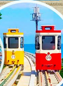
นั่งรถไฟปู๊กบีก

ราคานี้รวมค่าภาษีน้ำมัน + ค่าภาษีสนามบิน