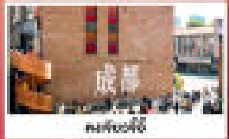
หนานหนาน