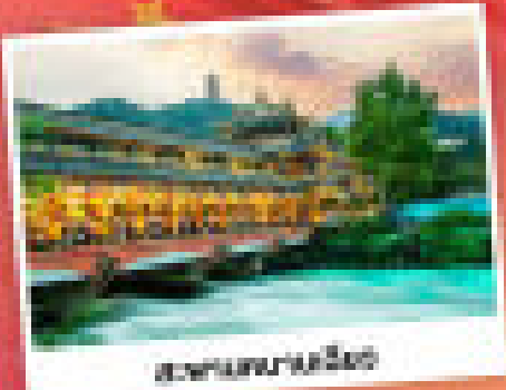
อุทยานแห่งชาติสิ่วหวาน