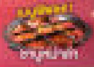
อาหารจีน