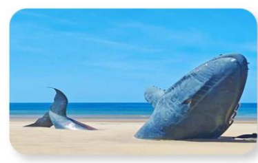
ประติมากรรมวาฬผู้โดคเตี่ยว