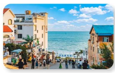
ถนนคอบเพลิงหมายเลขแปด