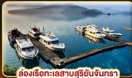
ล่องเรือทะเลสาบสุริยจันตรา