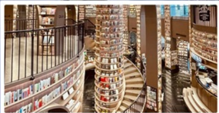
ร้านหนังสือจุงซูเก้อ