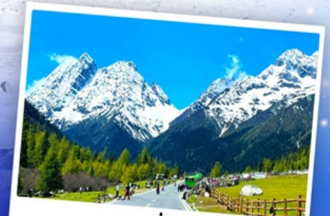
กุเวาสีดรุณี