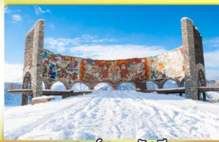
อนุสรณ์สถานรัสเซีย