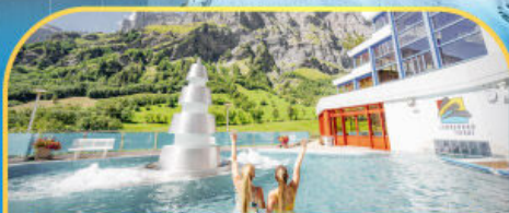
แช่น้ำแร่ร้อนผ่อนคลายลวยคอร์บิต