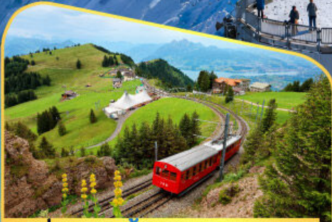
นั่งรถไฟขึ้นสู่ยอดเขาโรกิก