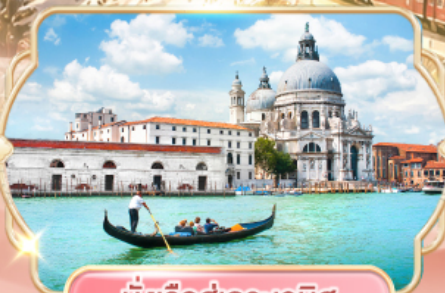
นั่งเรือสู่เกาะเวนิส