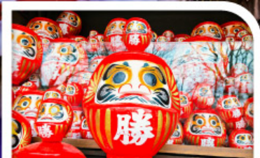
วัดแห่งชัยชนะ-วัดคัตสึโองิ(วัดคารุมะ)