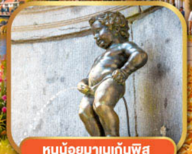
หนูน้อยมานกันพิส