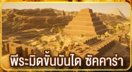
พีระมิดขั้นบันได ชัคคาร์่า