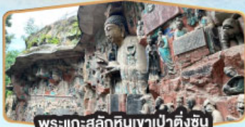
พระแกะสลักหินเขาเป่าตั้งชัน