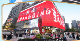
ถนนคนเดินทงยวนเฉียว