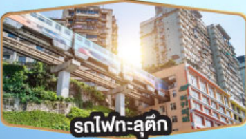
รถไฟฟ้าชุกติ