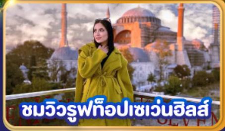
ชมวิรูฟทือปเซเวนฮิลส์