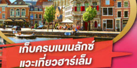
จัตุรัสโรมบอร์