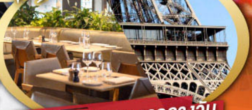
รับประทานอาหารกลางวัน บนหอคอยไอเฟล

ไฮไลท์ในโปรแกรม • ถ่ายรูปหอคอยไอเฟลและพิพิธภัณฑ์ลูฟว์ • สะพานไม้ชาเปล ลูเซิร์น • ขึ้นกระเช้าสู่ยอดเขาจุงเฟรา • เมืองมรดกโลก กรุงเบิร์น • ถ่ายรูปปราสาทชิลยงที่มืองเกรอซ์ • ศาลาไทย เมืองโลซานน์ • เดินเพลินๆ ณ เมืองเวเวย์