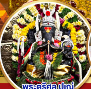
พระตรีศูล ปูณ (Trishul Pune)