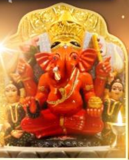
องค์สิทธินายัก