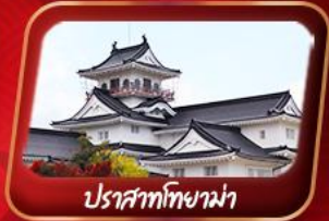
ปราสาทโทยาม่า