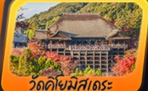
วัดคิโยมิสุเดระ