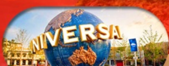
อิสระฟรีเดย์ 1 วัน หรือเลือกซื้อทัวร์เสริม US