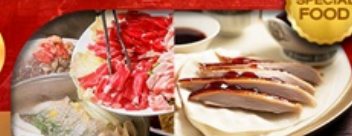
เมนู สุกี้มองโก + เปิดปักกิ่ง เดินทาง เม.ษ. - ต.ค. 69