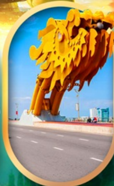
สะพานมังกรคานัง