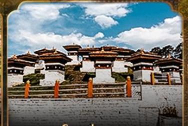
โดชูล่าพาส DOCHULA PASS