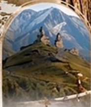
คาสเบกี 4WD EXPERIENCE