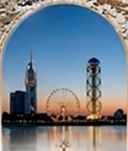
บาทุมี BLACK SEA BOULEVARD