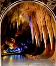
ดำโพรมิริอุส BOAT RIDE

เดินทางช่วงปีใหม่ 27 ธ.ค. - 3 ม.ค. 70 ราคาเพียง 75,989 บาท / ท่าน